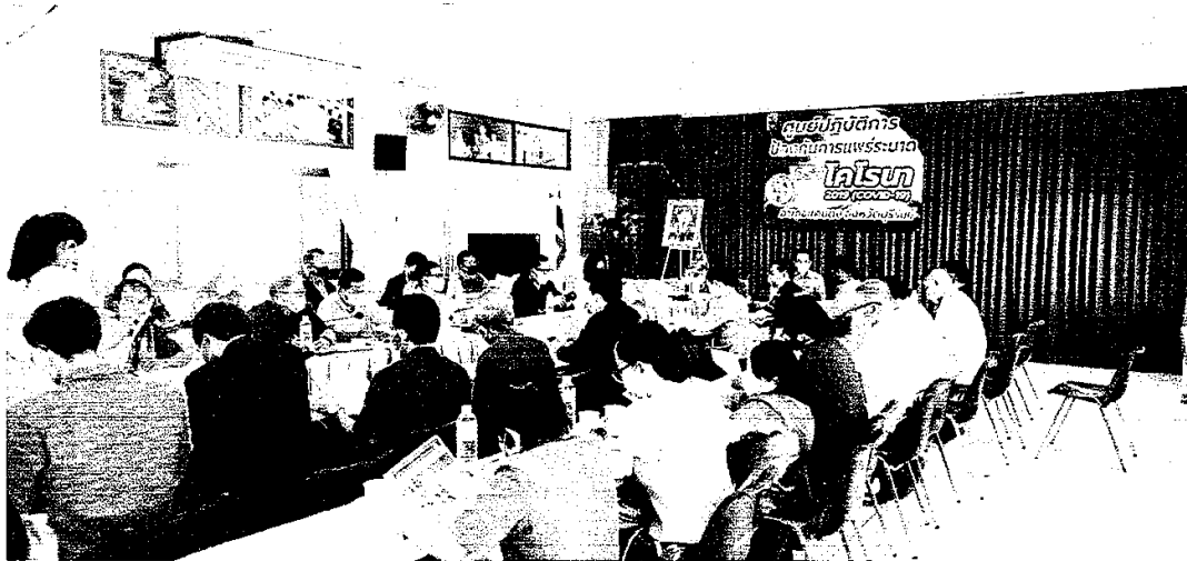
ภาพกิจกรรมการประชุมคณะกรรมการพัฒนาคุณภาพชีวิตระดับอำเภอ(พชอ.) ร่วมกับภาคีเครือข่ายสุขภาพ อำเภอแคนดง จังหวัดบุรีรัมย์ ในวันที่ ๒๕ มกราคม ๒๕๖๔ ณ ห้องประชุมที่ว่าการอำเภอแคนดง ชั้น ๒