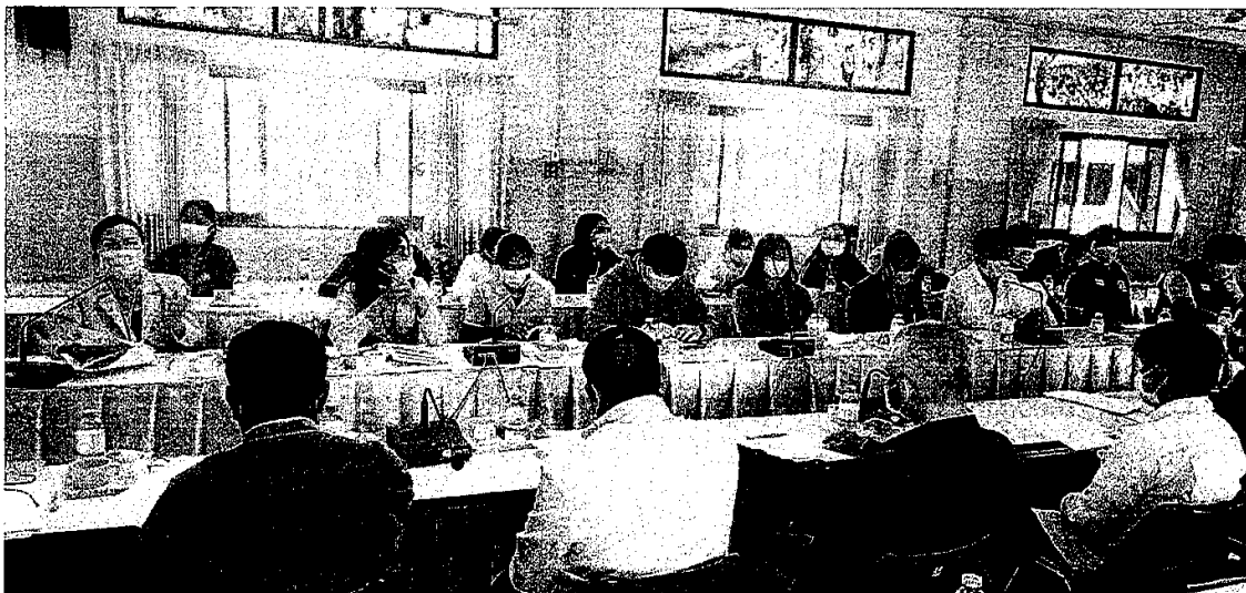
ภาพการประชุมภาคีเครือข่ายคณะกรรมการพัฒนาคุณภาพชีวิตระดับอำเภอ (พชอ.)อำเภอแคนดง จังหวัดบุรีรัมย์ ครั้งที่ ๒/๒๕๖๔ ในวันที่ ๑๔ มกราคม ๒๕๖๔ ณ ห้องประชุมที่ว่าการอำเภอแคนดง ชั้น ๒